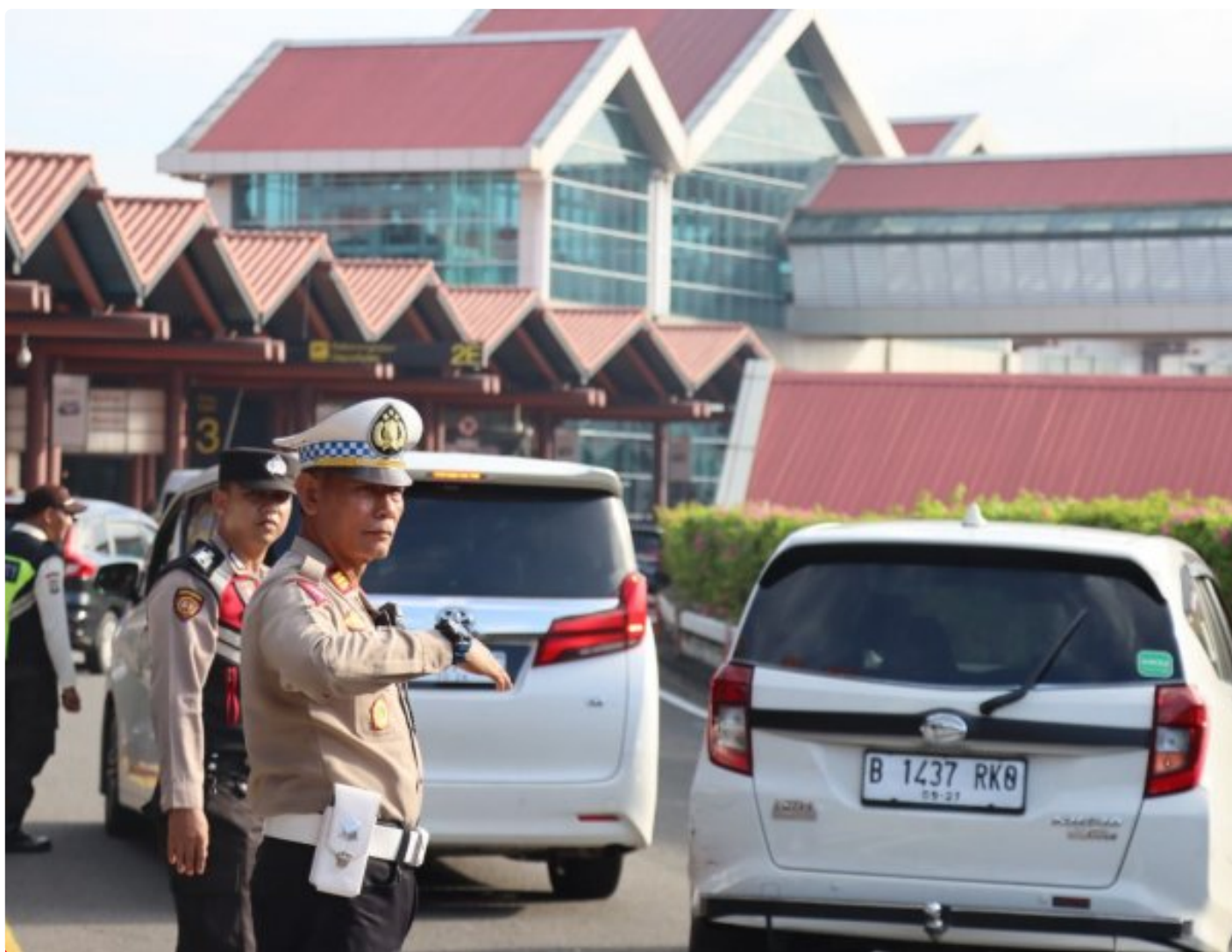
Personil gabungan dari Satlantas Polresta Bandara Soekarno-Hatta sedang Melaksanakan Pengaturan Lalulintas, Kamis, (25/1/2024)